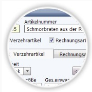
Artikelverwaltung (u.a. Gerichte)

Dine.RS ist eine Software für die Organisation Ihres Menüservices im Bereich Care/Education-Catering